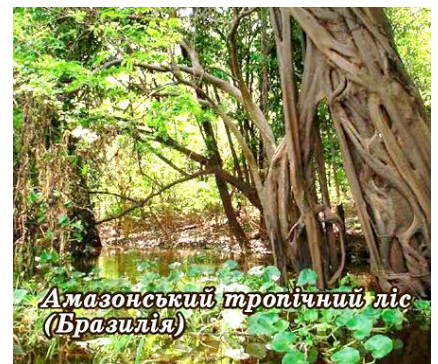
Амазонський тропічний ліс (Бразилія)

Впродовж життєвого циклу людина використовує близько 100 м 3 деревини – це невеликий гай. Для виготовлення одного листа паперу формату А4 потрібно від 13 до 21 г якісної деревини, а для однієї книги – близько 5 кг деревної сировини. За годину гектар лісу поглинає стільки вуглекислого газу, скільки за годину видихають 200 людей.