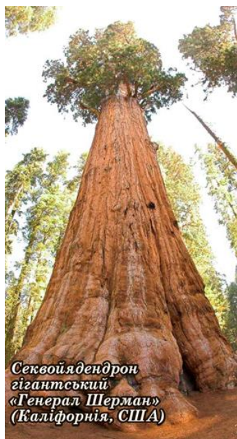
Секвойядендрон гігантський «Генерал Шерман» (Каліфорнія, США)

У лісах проживає близько 80% світового наземного біорізноманіття. Лісові масиви складаються з понад 60 тис. видів дерев. Понад мільярд людей безпосередньо залежить від лісів, як від джерела продовольства, даху над головою, енергетичних ресурсів та прибутку. Генетична різноманітність допомагає лісу протистояти змінам клімату та іншим загрозам.